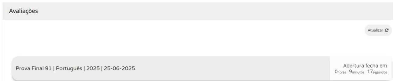
Figura 2 – Acesso à prova a realizar